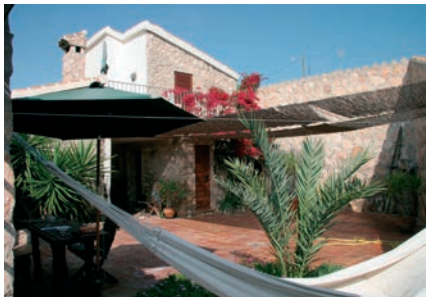
▲ Mediterrane Kreativ-Oase - das Kurshaus

Workshop Bedingung. Reisekosten, Mietauto und Verpflegung trägt jeder Teilnehmer selbst.